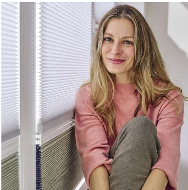
Passend zur Sonderausstellung werden die nachhaltigen Produktinnovationen von Hunter Douglas im Look einer Galerie präsentiert.

mehr ergänzt. GreenScreen SeaTex, Plissees, Jalousien wie auch die transluzente Hi-Light Serie überraschen mit vielen Neuheiten. So werden auch Produktlinien der Hunter Douglas Systeme gezeigt, die mit technischen Innovationen im Detail viele Vorzüge und viel Erfolgsversprechendes für die Zukunft bieten. Beim Thema Motorisierung und Smart Home werden die verschiedenen Systeme konzeptionell in inspirierenden Lebenswelten präsentiert – mit den ganz individuellen Vorzügen für die unterschiedlichen Zielgruppen und Kundenanforderungen. Ergänzt wird die Sonderausstellung durch die Sieger Design Experience, textile Design-Inspirationen, Material-Inspirationen, Neuheiten im außenliegenden Sonnenschutz und vielem mehr.