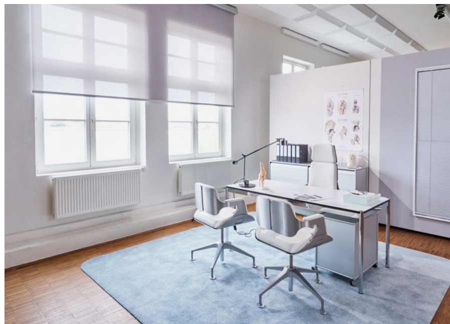
Wohnwelt „AntiViral“, angelehnt an die Gestaltung einer Arztpraxis, zeigt verkabelte Motorisierungslösungen in Kombination mit antiviralem Gewebe.

Artikeln ermöglicht es ein komfortables und automatisiertes Wohnerlebnis. Der Homematic-IP Access Point und die App bilden die Basis des innovativen Smart Home-Systems, das großen Wohnkomfort zu jeder Tageszeit bringt. Für größten Komfort und hohen Designanspruch steht die „PowerView“-Motorisierung, die in der „Japandi“-Wohnwelt präsentiert wurde – sie verbindet japanisch reduzierte Ästhetik mit skandinavischem Designanspruch und hochwertiger Qualität. „PowerView 3.0“ ist intelligenter Sonnenschutz und innovative Technik zugleich. Mit „AntiViral“ wurde ein pragmatischer, nutzenorientierter Lösungsansatz mit formreduzierter Einrichtung, wie zum Beispiel im Arzt- oder Sprechzimmer, inszeniert. Er zeigt verkabelte Motorisierungslösungen im Gegensatz zu den akkubetriebenen. Der Einsatz eines antiviralen Gewebes unterstreicht den nutzenorientierten Lösungsansatz.