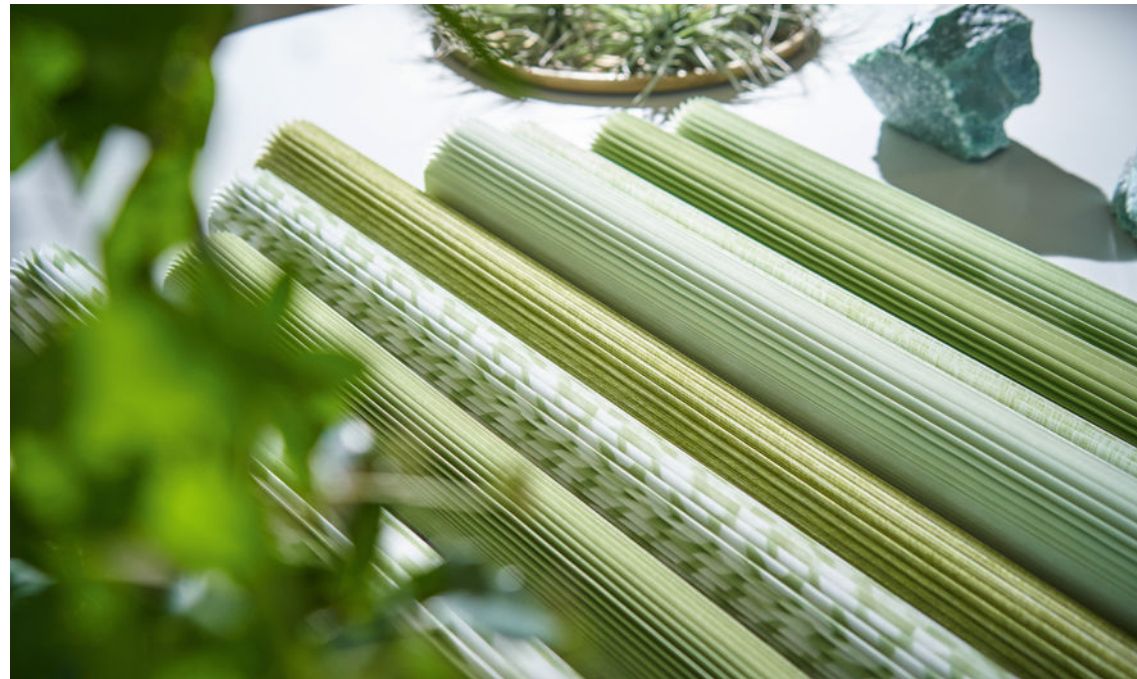
Die neuen Duette-Qualitäten gibt es in angesagten Metallic-Colours, beidseitig bedruckt oder – wie hier – in frischen, jungen Farbtönen.

Nachhaltigkeit und Mehrwert entwickelt. So basieren die neuen Plisseestoffe zu hundert Prozent auf nachhaltigen Grundwaren, die Topseller „Crêpe FR“, „Crush“ und „Chintz“ werden ebenso darauf umgestellt. Einen stylischen Akzent setzt das Design-Update mit neuen Dessins im aktuellen White-in-White-Look, modern und atmosphärisch zugleich. Duette-Wabenplissee, bekannt für hohe Energieeffizienz, wird um neue Qualitäten sowie um außergewöhnliche Designthemen ergänzt, die erstmals eine komplette Coordinate-